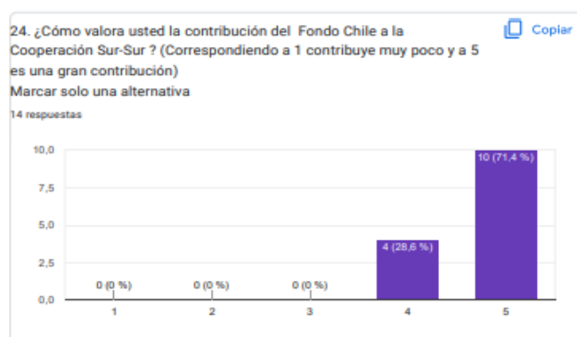
Gráfica 3: Respuestas de la Encuesta sobre Contribución del Fondo Chile